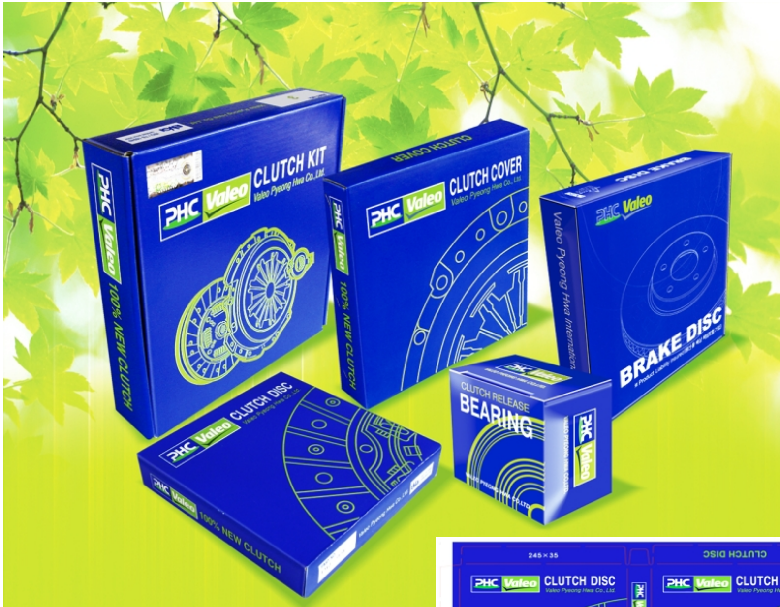
PLANO CAJA ANTERIOR